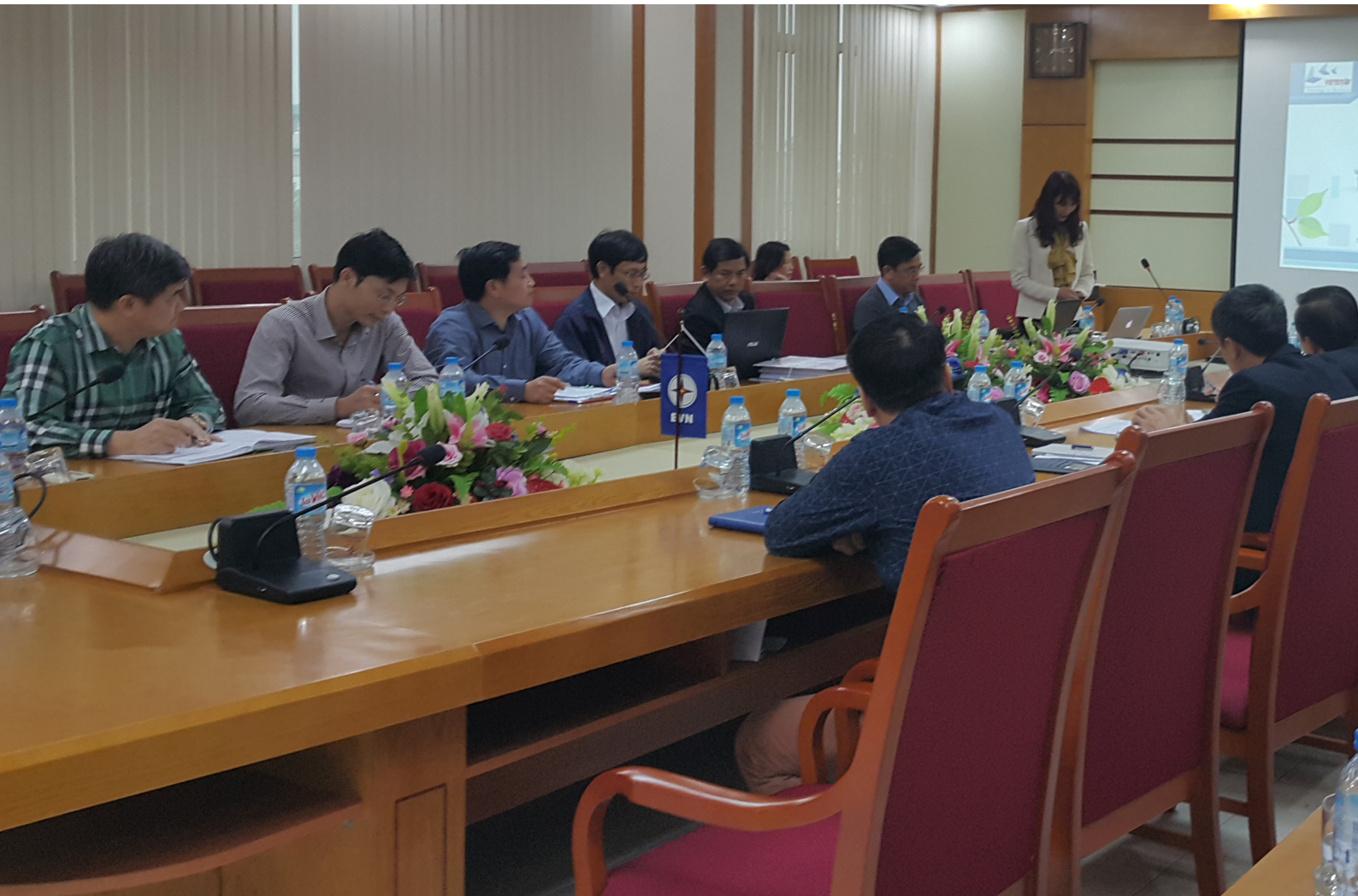
Tư vấn xây dựng hệ thống BSC/KPIs tại Công ty điện lực Quảng Ninh

Our risk management consultancy deals with the risks related to property, technology, finance, legal compliance and operation throughout the enterprise. We commit to support clients with risk management in their organization by a strategic vision and designed solutions to obtain the risk management objectives as well as business goals. By utilizing data and leading analysis methods, we assess the risks and vulnerabilities in the risk management activities of clients to help them identify the return on investment and make decisions on adjustments and orientation.