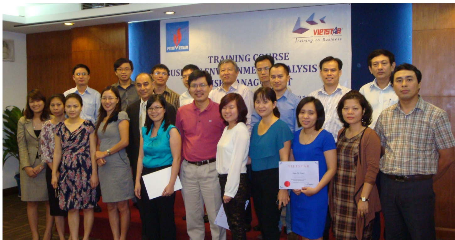
KHÓA HỌC PHÂN TÍCH MÔI TRƯỜNG KINH DOANH VÀ QUẢN LÝ RỦI RO CHO LÃNH ĐẠO/ QUẢN LÝ TRỰC THUỘC TẬP ĐOÀN DẦU KHÍ QUỐC GIA VIỆT NAM PVN

Nội dung của những khóa điều hành cao cấp của chúng tôi đề cao tri thức và nghiên cứu thực tế về những động lực phát triển kinh tế, những xu thế trong tương lai và những thị trường chuyển đổi. Sự kết hợp này mang lại những lợi ích giá trị cho cá nhân/tổ chức tham gia, đặc biệt là những cá nhân/tổ chức làm việc trong môi trường toàn cầu hóa.