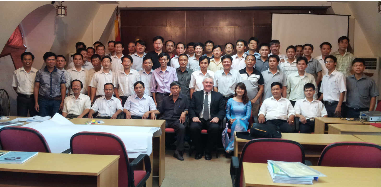
Hình ảnh đào tạo tại Tổng Công ty Điện lực miền Bắc EVNNPC

New business models and organizational complexity require rapid action, flexibility and new managerial skills to properly address unforeseen situations, changes and critical events in a work environment. What makes a difference for business results is the quality of interpersonal relationships, the development of people's skills, the ability to work as a team, and the effectiveness of decision-making processes. Taking that fact into consideration, VietStar has tailored and delivered several training programs on soft skills for executives, managers and staff.